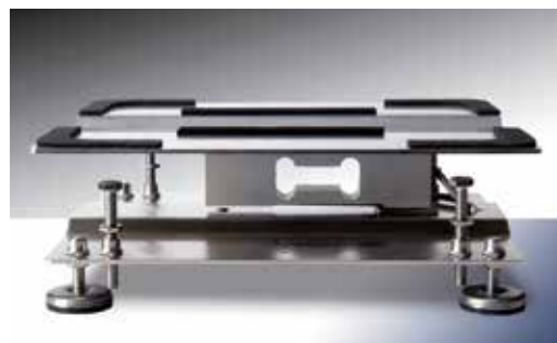
Particolare della struttura interna