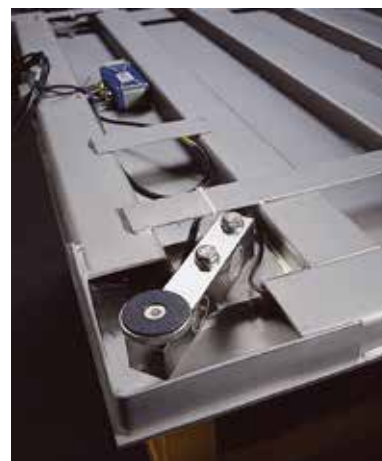
Alloggiamento cella di carico (particolare)